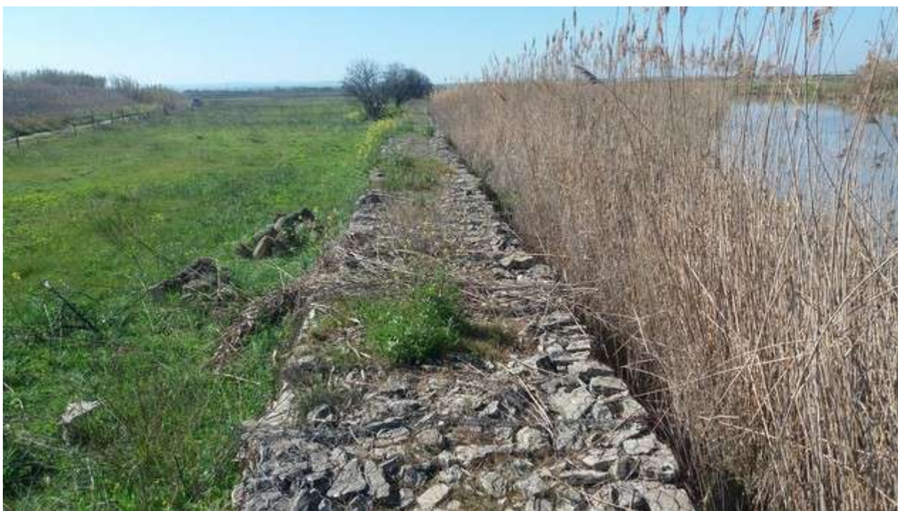
Foto 13: area della futura valle C con l'area di piantumazione a tergo (area E)