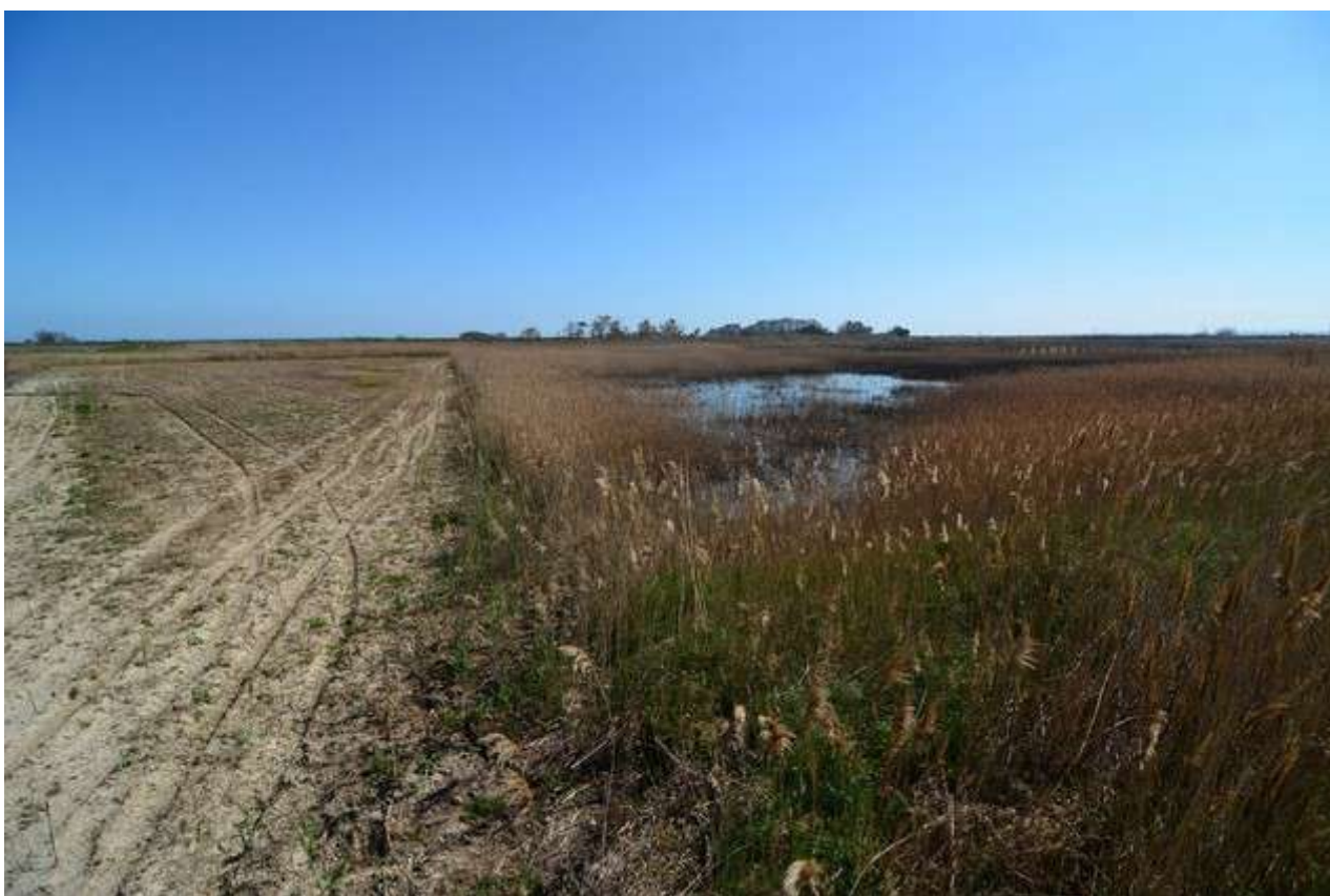
Foto 8: area della futura valle A con la piccola zona umida esistente